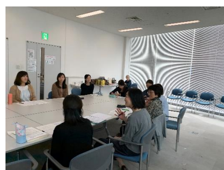
発表の後の情報交換です